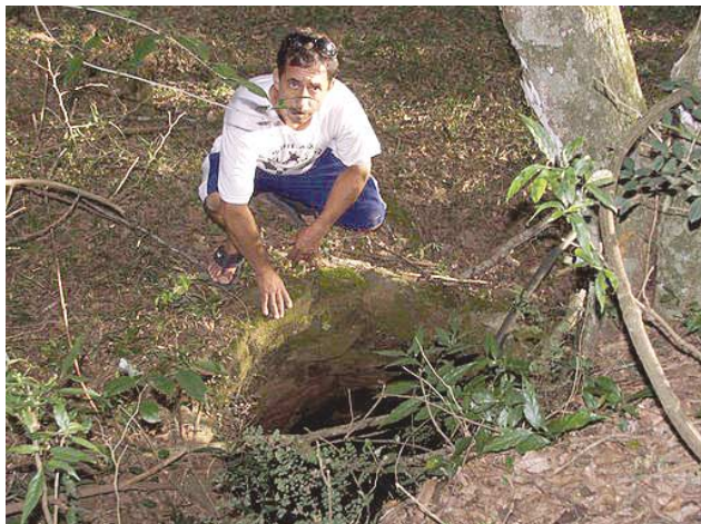
Grande parte dos moradores do bairro utiliza fontes alternativas de água