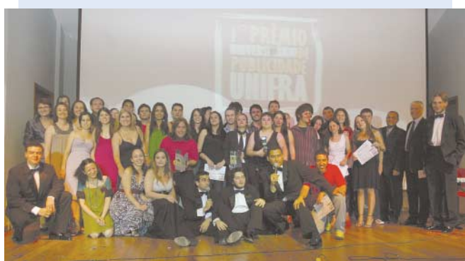
Solenidade teve o glamour dos grandes eventos publicitários