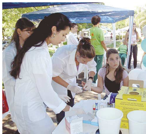
Evento mobilizou os cursos da Área da Saúde