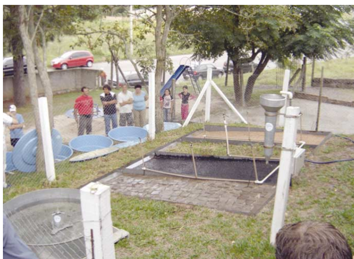
Experimento simulou escoamento de água em quatro tipos de superfície de solo