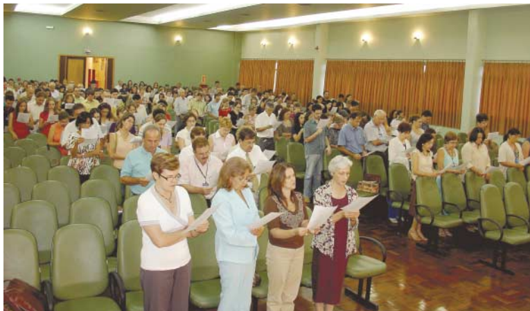
Professores, funcionários e dirigentes tiveram momento religioso no Salão de Atos

Uma celebração eucarística promovida pela Pastoral UNIFRA marcou as atividades de recepção aos alunos neste início de primeiro semestre letivo de 2008. A missa realizada no dia 12 de março, na Capela do Colégio Franciscano Sant'Anna, reuniu alunos veteranos e calouros. Outra celebração religiosa ocorreu no Salão de Atos do Conjunto I, reuniu professores, funcionários e dirigentes da Instituição em mais um momento de elevação espiritual da comunidade franciscana.