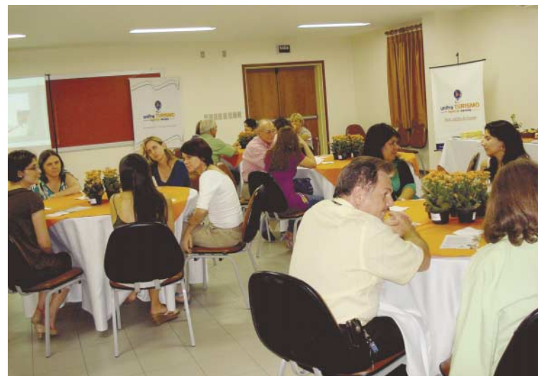
Serviços da Agência Escola de Turismo reduzem custos para a comunidade acadêmica