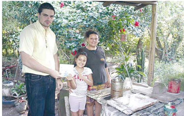
Cartilha entregue à comunidade traz orientações sobre a qualidade da água