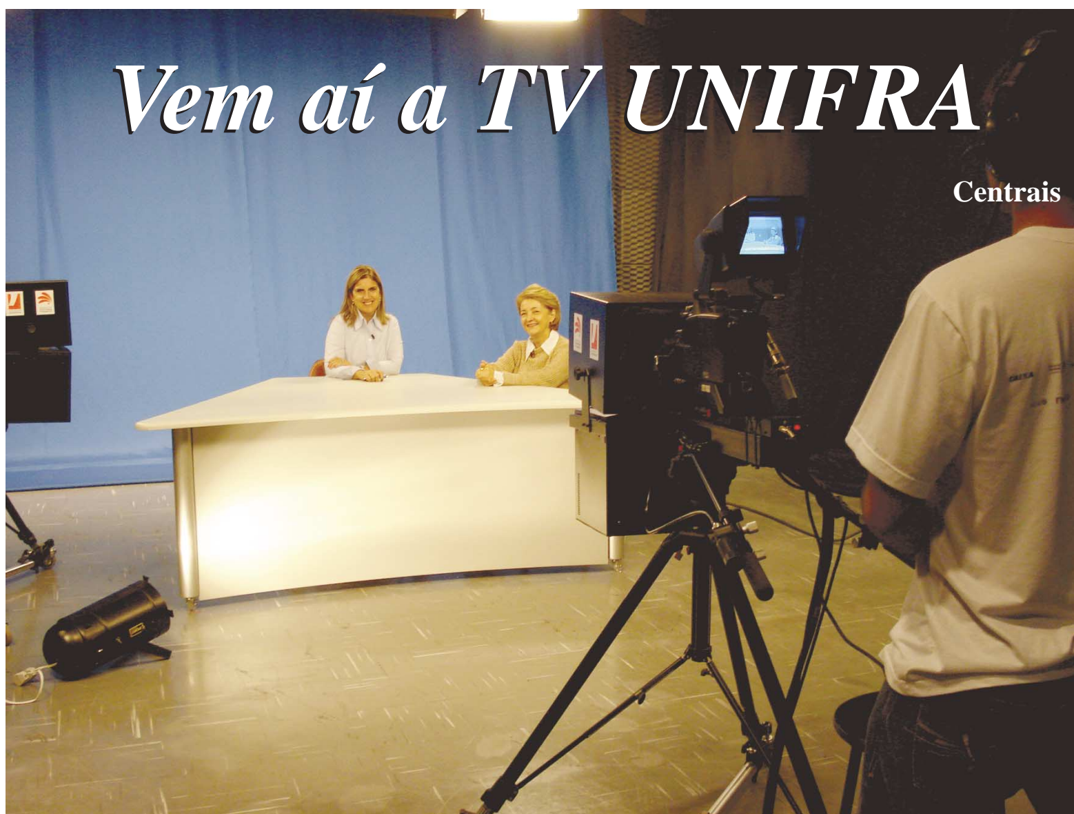
Com programação definida e conteúdo pronto para ser exibido, estréia da emissora depende de detalhes que envolvem geração do sinal no Canal Universitário

Direções de Áreas e coordenações de cursos com novos titulares