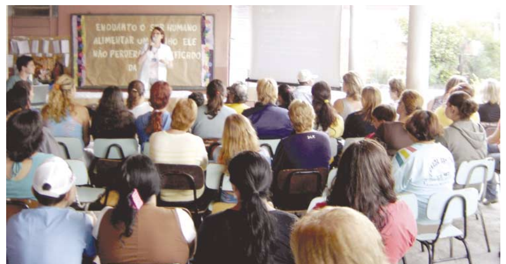
Comunidade escolar participa ativamente das atividades do Projeto Tec-Água

Demonstrou-se o uso de estruturas para coleta, separação de resíduos e armazenamento de água da chuva em cisternas (devidamente protegidas, para evitar o acesso do mosquito), visando não só reduzir o pico de descarga nos coletores pluviais e, com isso, reduzir os impactos dos alagamentos em zonas urbanas, como também reduzir o consumo da água da CORSAN